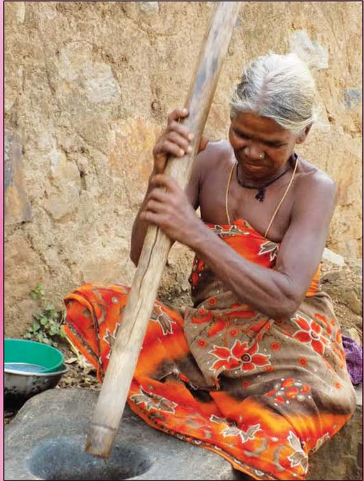
ഇരുളൂർ ഗോത്രത്തിലെ ഒരു സ്ത്രീ

Tribal Mission Iringole P.O. Perumbavoor - 683 545 Ernakulam Dist Kerala, India, Ph : 0484 2593866